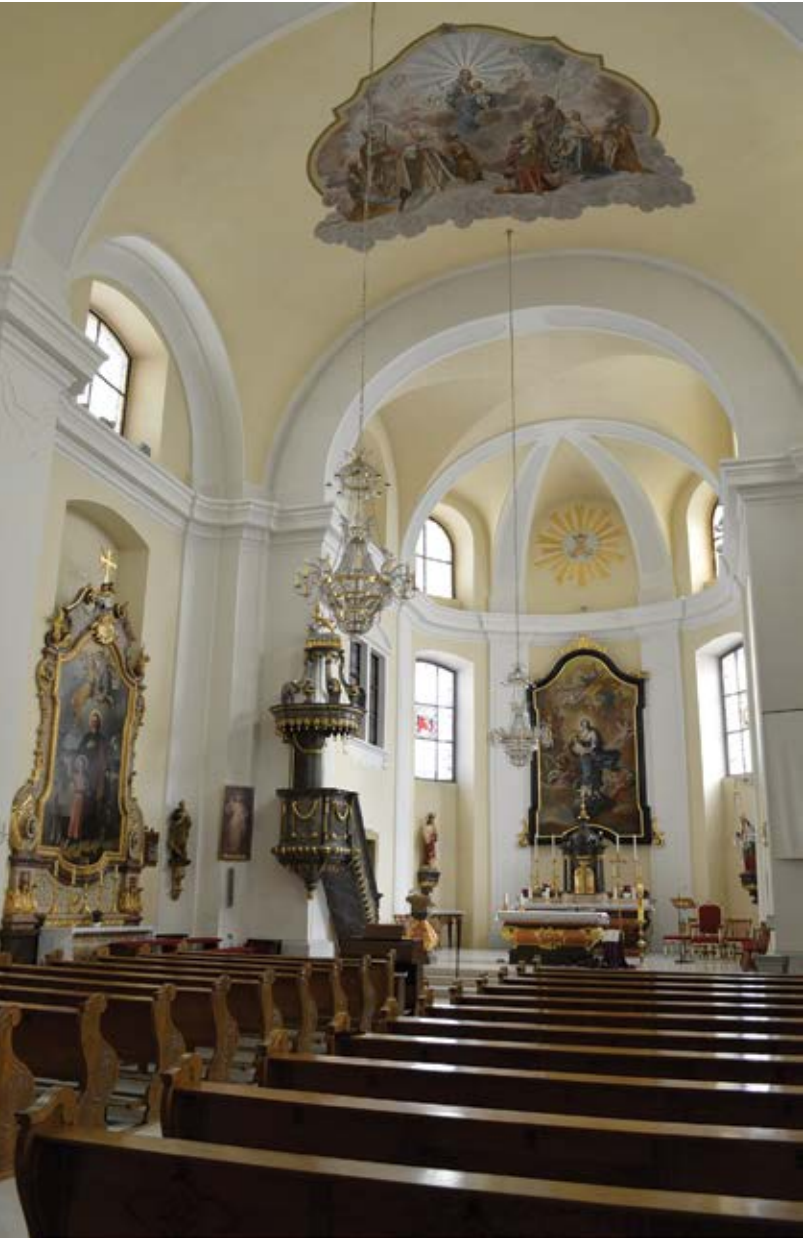
Sl. 4. Valpovo, župna crkva Bezgrešnog začetca Blažene Djevice Marije, unutrašnjost, pogled prema svetištu