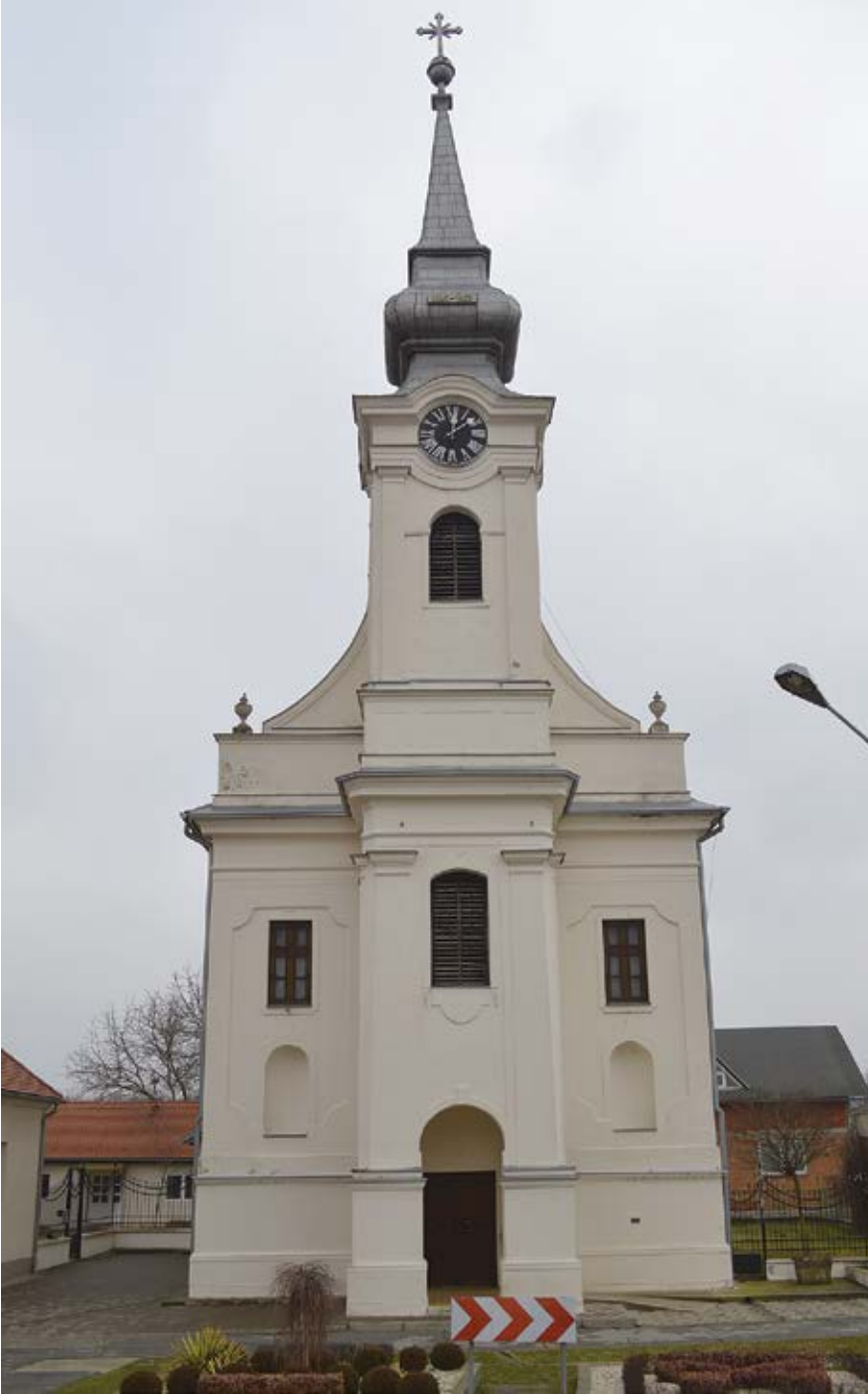
Sl. 7. Podravski Podgajci, župna crkva sv. Petra, pročelje

kutova, na koji se nastavlja nešto uže svetište stiješnjenog zaključka. 66 Početkom 19. stoljeća grade se crkve sv. Mateja u Bizovcu (1802.), 67 petrijevačka filijalna crkva sv. Katarine u Satnici (1808., 1834.), 68 valpovačka filijalna crkva sv. Stjepana u Bistrincima (1813.), 69 crkva u Ladimirevcima (1815.), 70 šljivoševačka filijalna crkva u Lacićima (1817.) 71 i