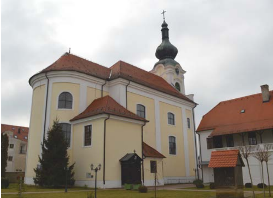
Sl. 3. Valpovo, župna crkva Bezgrešnog začeća Blažene Djevice Marije, pogled prema svetištu i južnom pročelju