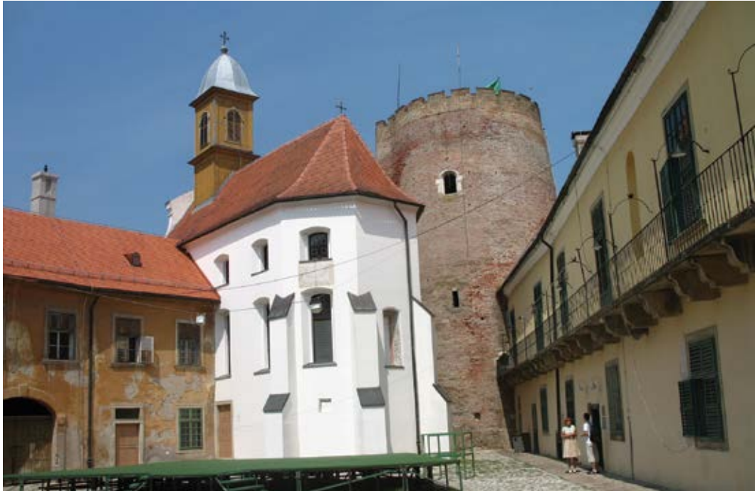
Sl. 1. Valpovo, dvorska kapela Presvetog Trojstva, pogled na kapelu iz dvorišta dvorca